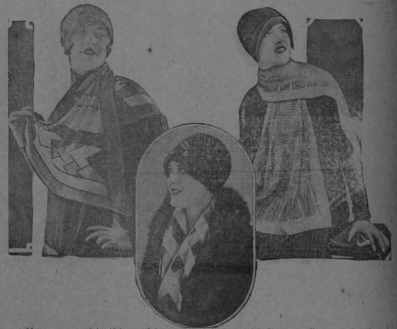
Mostramos aquí la última palabra en cuanto al uso del Chal se refiere, que ha llegado a ser una necesidad de la moda modernista. A la izquierda un exquisito modelo de crepé de chirre, siendo pintado a mano con diseños modernistas. En el centro vemos uno de seda con dibujos a cuadros blancos y negros. Y a la derecha se ve otro elegantísimo modelo que por su originalidad y sencillez llama la atención.