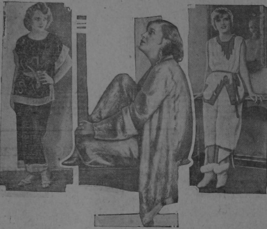
He aquí tres bellos modelos de pijamas, los que muestran tres estrellas del cinema. A la izquierda, Carol Lombardo, de la "Pathé", luce un modelo hecho de satén negro con bordados de oro en un diseño chino y adornado con crepón verde claro. En el centro, Olga Bacalova, de la "Paramount", nos muestra un bello modelo de satén rojo. Y a la derecha, Diane Ellis, de la "Pathé", luce un modelo exquisito rojo y blanco de estilo modernista.